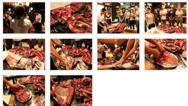
第一回エゾシカ肉頒布会 エゾシカファンクラブさん作成(アルバム)・13時目前に更新・アルバムを編集

※なお、シカチャリティ義捐金：前回までで50,000円越えました！（14T含む）ありがとうございます。