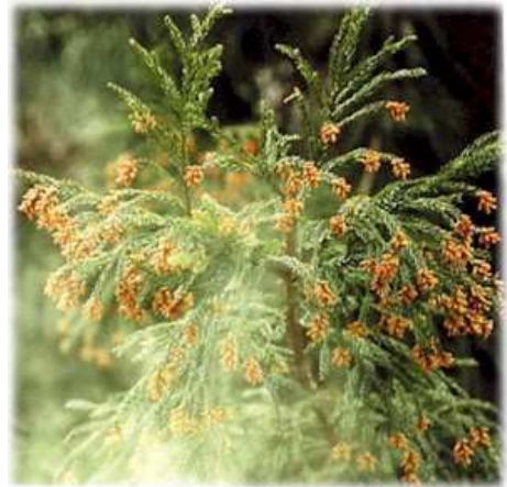
↑こんな写真みるだけで、 むずむずします

3月になりました。そろそろ梅祭りが開催されたり、沈丁花の香りを感じたり、、、ウキウキする、いい季節の到来です。が、店主的にはつらい時期なんです。そう、花粉、スギ花粉症です。こいつを鼻で感じると、春が来たな〜と思い、症状が収まると、夏が来たな〜と思います。1年の1/4がつらい時期って、とても悲しくなります。ついでに言うと、花が利かなくなるこの時期、料理の味も・・・いや、まったく申し訳ありません。